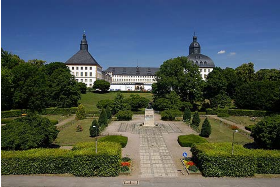
Gotha, Schloss Friedenstein.