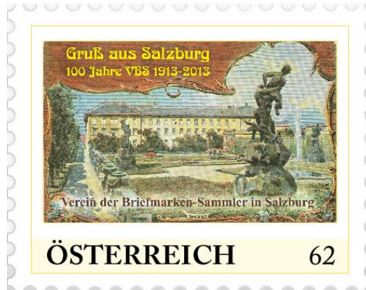
Sondermarke 100 Jahre VBS Salzburg.

herausgegeben, die beim Sonderpostamt in der Wolf-Dietrich-Halle, in der auch eine Briefmarkenschau gezeigt wurde, angeboten. Das Festkuvert und zwei limitierte Festkarten halten die Vereinslokale des jubilierenden Vereins bildlich fest.