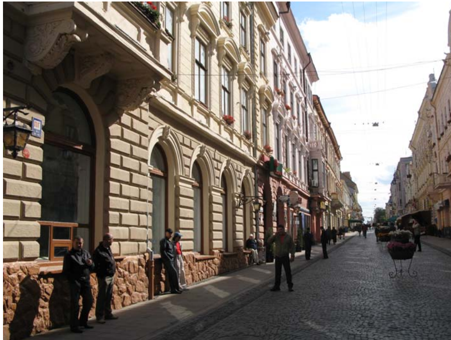
Czernovitz, ehem. Herrengasse.